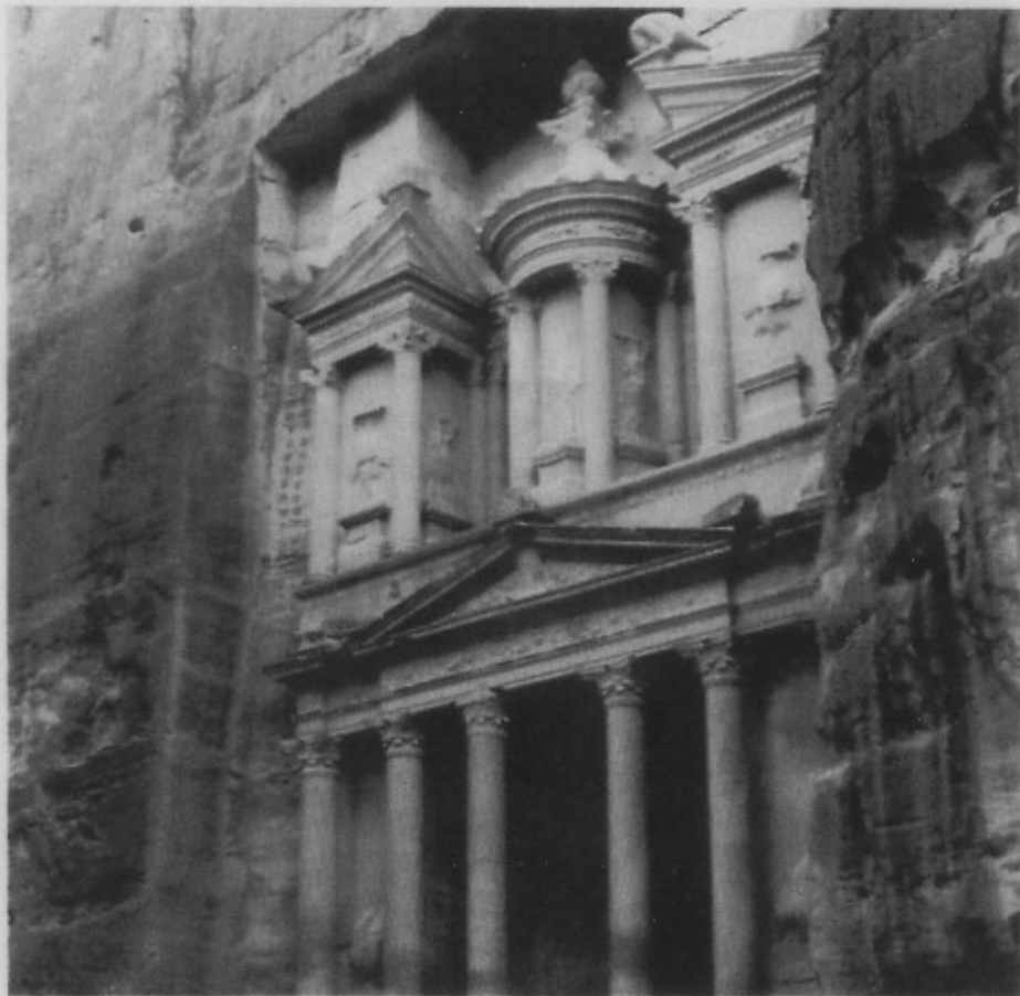
אוצר חבוי בכד. ארמון חזנת פרעון

"לא יכול להיות שום מצבם תגייסו ככה", אומר